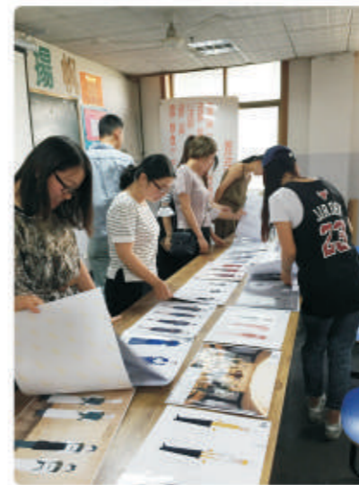
评委们初选设计稿

大赛由服装学院发起，机关服务中心承办，以学以致用为目的，将《专题设计——职业装设计》课程与仙聚山庄职业装设计实践项目相结合，增强教学实践性。